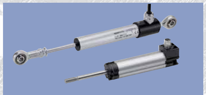
接触式电位器直线位移传感器 型号: TX2, TEX