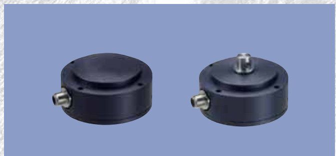
无机械磨损、非接触式或接触式角度传感器 型号：RSX，RFX，IPX