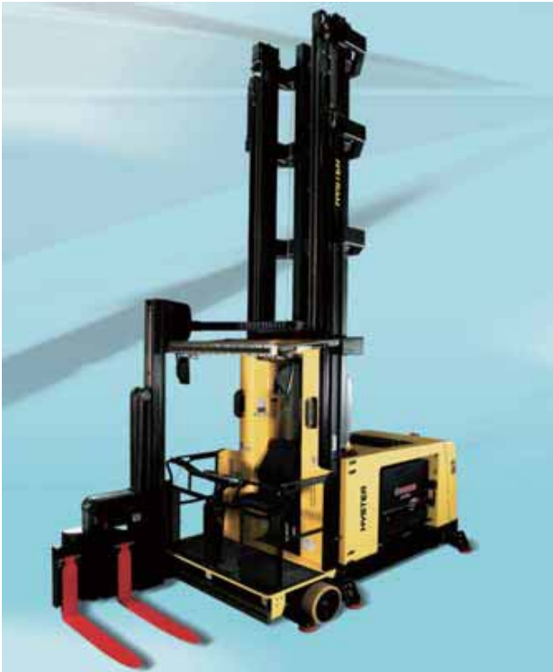
TEX, RSC 2800, RFC 4800, RSM 2800系列产品 应用于VNA叉车