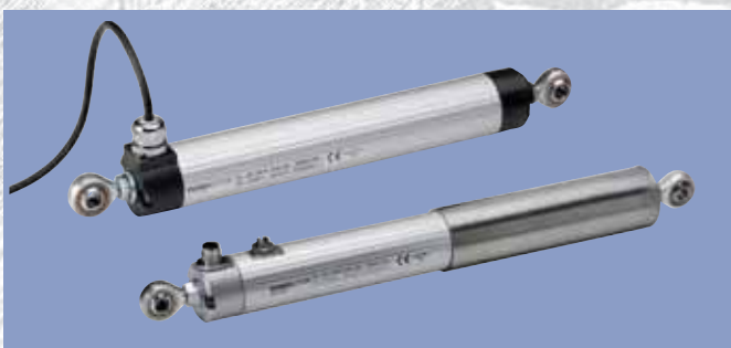
接触式电位器直线位移传感器 型号: LWG, LWX