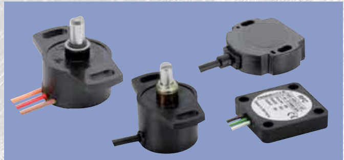
无机械磨损、非接触式或接触式角度传感器 型号：RSC，RFA，RFC，SP，RSM 2800